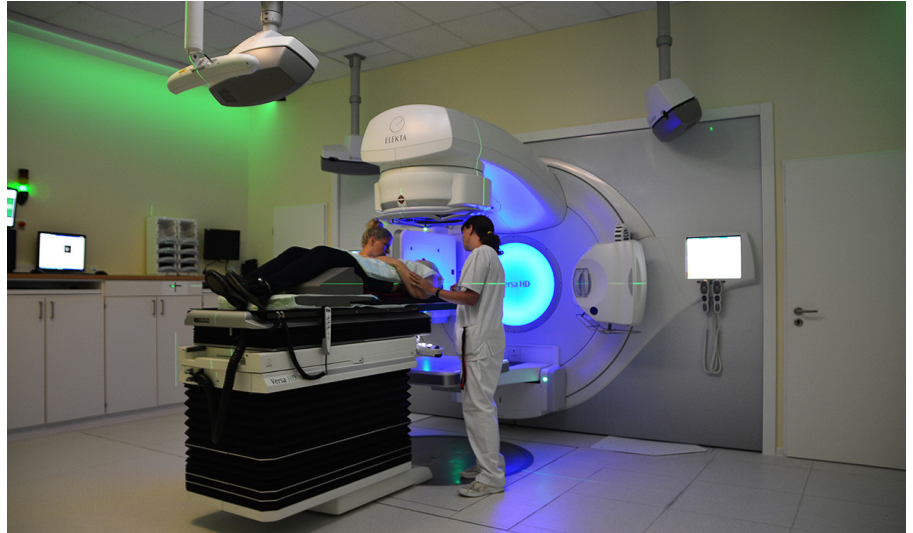
Der Versa-HD-Beschleuniger ermöglicht eine schnelle und präzise Bestrahlung.

Der erste Patient ist am neuen Linearbeschleuniger der Strahlenklinik behandelt worden. Mit dem hochmodernen Großgerät können Krebspatienten jetzt in kürzerer Zeit und noch schonender bestrahlt werden. Der Versa-HD-Linearbeschleuniger der Firma Elekta ersetzt das Vorgängergerät, das seine Laufzeit nach zehnjährigem Betrieb erreicht hat. Es ist das erste von drei Großgeräten, die in den nächsten zwei Jahren durch neue Modelle ersetzt werden. Unsere UMR finanziert den Gerätetausch zu 100 Prozent aus Eigenmitteln. Anschaffung, Wartung für die nächsten zehn Jahre und Umbau der Bestrahlungsräume umfassen ein Investitionsvolumen von knapp 12 Millionen Euro.