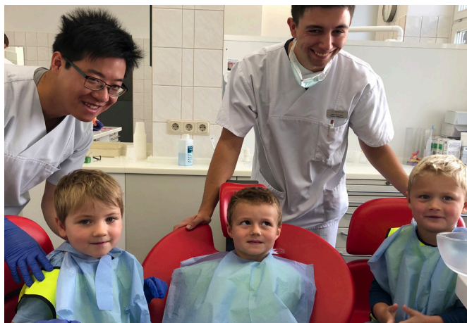
Die Studenten aus der Zahnmedizin haben den Tag der Zahngesundheit tatkräftig unterstützt.

urgie informiert. Über die Möglichkeiten der zahnärztlichen Implantologie, der Vorbereitung und Optimierung des Implantatlagers sowie die Anwendung therapeutischer Verfahren erkundigten sich viele Gäste bei den Mitarbeitern aus der Poliklinik für Zahnärztliche Prothetik und Werkstoffkunde. Bei einer Führung konnten sich die Besucher und Patienten ein Bild von der Ausbildung der Studierenden in der Zahnmedizin machen. Sie erhielten Einblicke in den neu ausgestatteten Phantomsaal und in die Behandlungssäle. Der Tag der Zahngesundheit in der Rostocker Zahnklinik war wie immer für alle Beteiligten ein großer Erfolg. „Wir danken