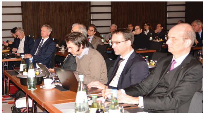
links: 91 Gäste diskutierten beim Führungskräfte tag