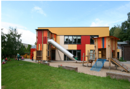
Der Betriebskindergarten „Gewächshaus“ wird über eine Wärmepumpe versorgt.