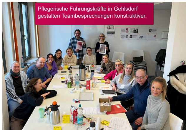
Pflegerische Führungskräfte in Gehlsdorf gestalten Teambesprechungen konstruktiver.

Mithilfe von Konsens-Karten werden Themen gemeinsam priorisiert. So entsteht ein Meinungsbild, das von