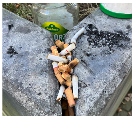
Die Bausubstanz wird beschädigt, wenn Zigaretten achtlos liegengelassen, in Rillen gequetscht oder an der Gebäudefassade ausgedrückt und dann fallen gelassen werden.

den ersten Eindruck unserer Einrichtung und beschädigt die Bausubstanz. Alle rauchenden Kolleginnen und Kollegen werden daher gebeten, für ihre Pause die ausgewiesenen Raucherplätze zu nutzen und Ziga-