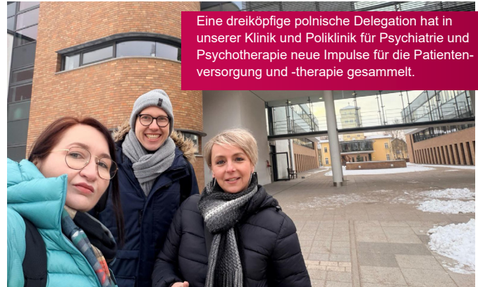
Eine dreiköpfige polnische Delegation hat in unserer Klinik und Poliklinik für Psychiatrie und Psychotherapie neue Impulse für die Patientenversorgung und -therapie gesammelt.